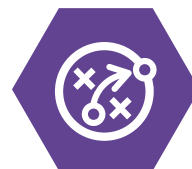
Recomendación de mejores prácticas