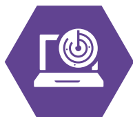
Técnicas y herramientas de atacantes reales